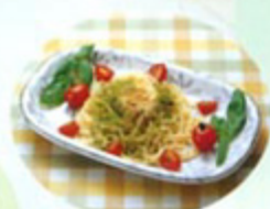
緑茶の香りと彩りを!