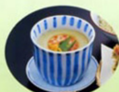
緑茶の鮮やかな風味