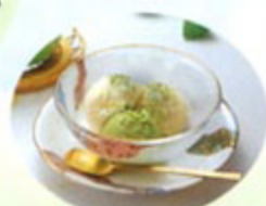
大人の味 本格緑茶アイス