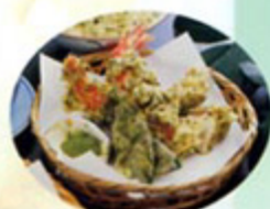
お料理に緑茶の風味を!