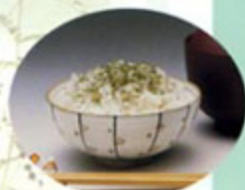
手軽にとれる健康メニュー